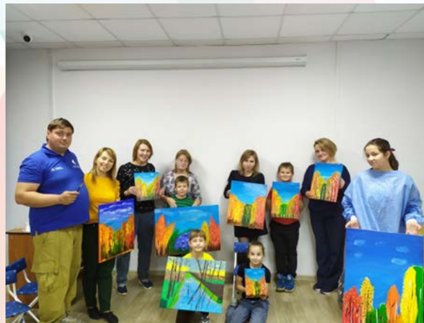
арт – тимбилдинг