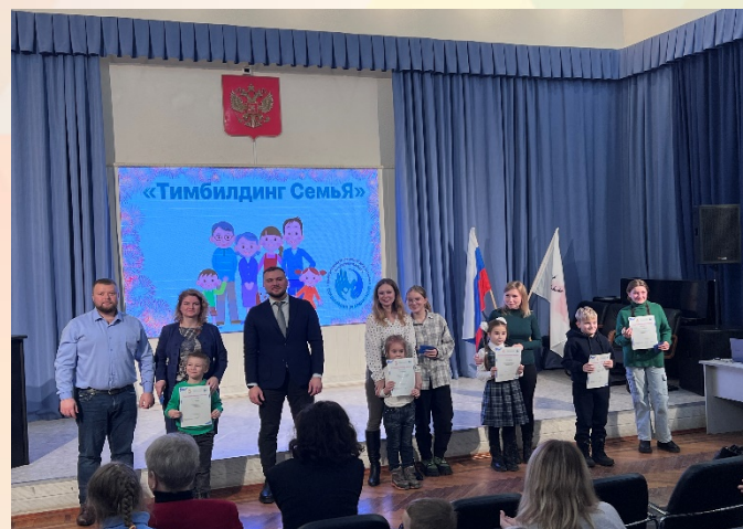
семейный день общения