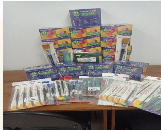
Арт - тимбилдинг